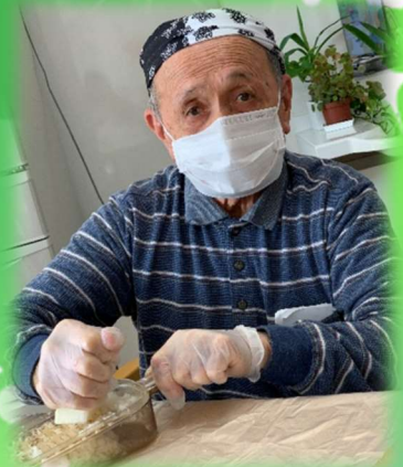
大根おろしはお任せあれ