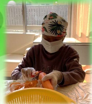
皮むきの手つきが早い！