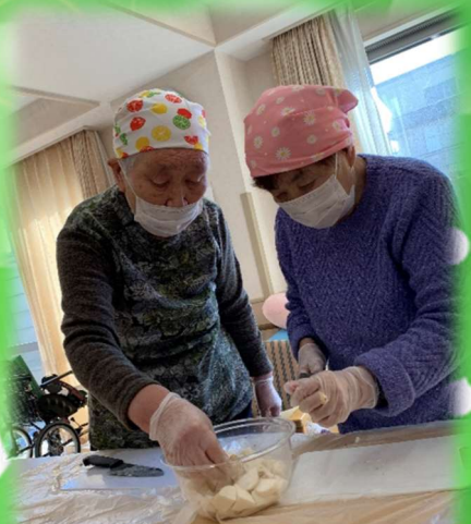
仲良くトントン さすがの包丁さばき！！